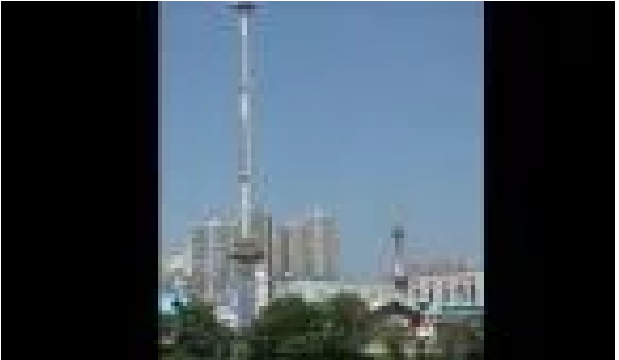
Το πιο τρομακτικό πα... (/video/pio-tromaktiko-paihni-sto-loyna-park) Στη Σεούλ της Νότιας Κορέας, το