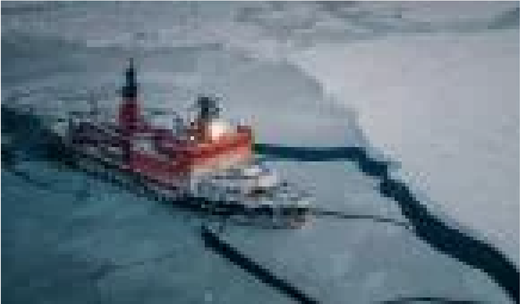
Το ρωσικό παγοθραυστ... (/video/rosiko-pagothraystiko-yamal-se-plana-apo-drone) Ένα DJI Inspire 2 drone εξοπλισ