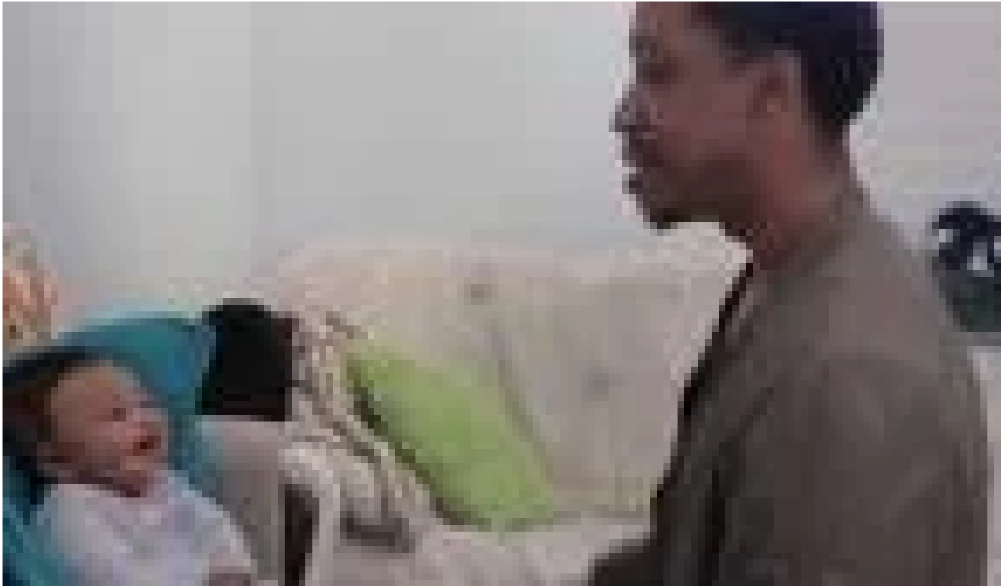
Ένα μωρό ξεκαρδιζετα... (/video/ena-moro-xekardizetai-otan-o-mpampas-toy-raparei) Ένας πατέρας ραπάρει στον 5 μην